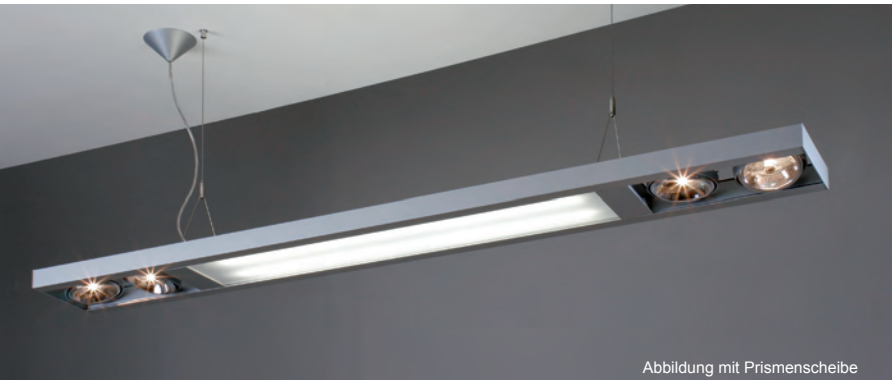
Abbildung mit Prismenscheibe